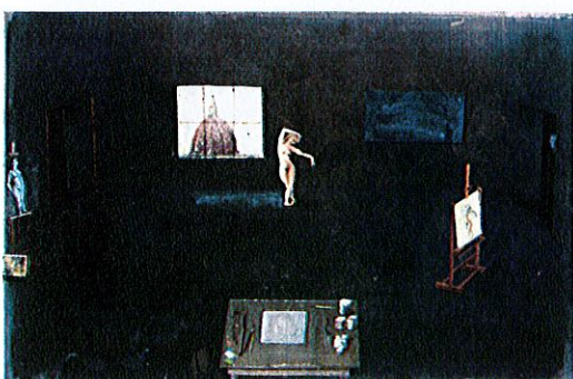
Scuola Libera del Nudo, gem. techniek op papier, 56 x 76 cm